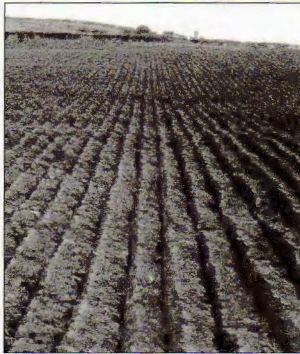
Byddwn wrth fy modd yn troi. Yma, cwysi yn Cae Llaur.