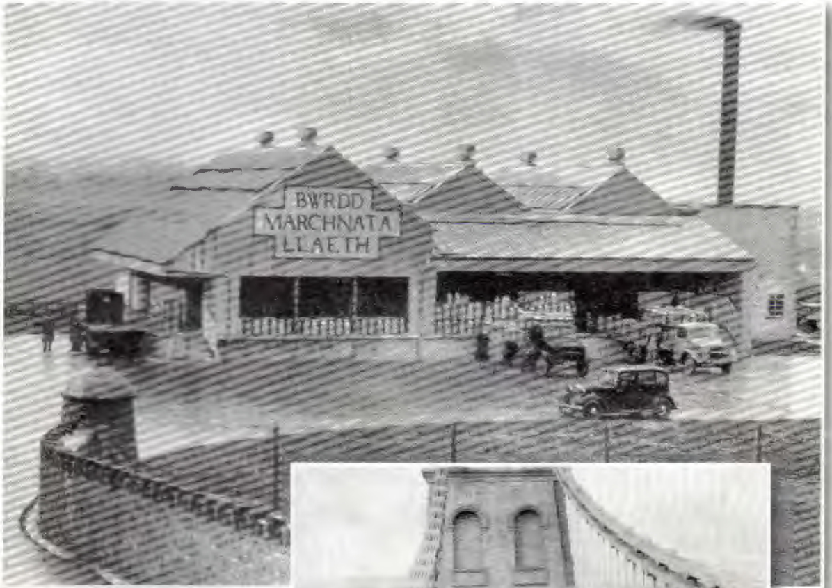
Hufenfa Llangefni (uchod) a chonfoi o danceri o Langefni'n croesi Pont Menai